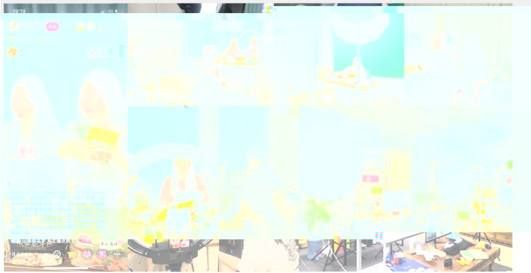
部份学员正在进行电商直播实训现场